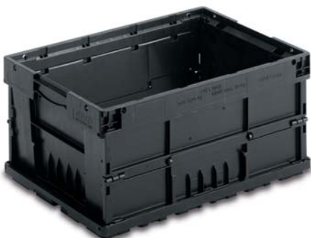
Складной KLT ESD